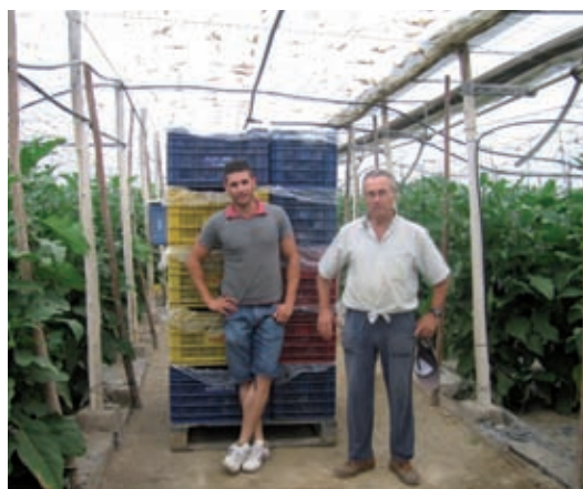
Figura 3. La falta rejuvenecimiento de la población activa agraria es uno de los riesgos de la agricultura Andaluza.

En esta unidad didáctica se explican las inversiones que pueden acogerse a estas ayudas, la cuantía de las mismas y los requisitos para obtenerlas.