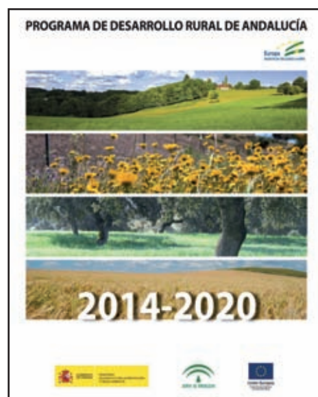
Figura 2. Portada del Programa de Desarrollo Rural de Andalucía 2014-2020

A continuación se analizan algunos aspectos de interés del Programa de Desarrollo Rural de Andalucía 2014-2020.