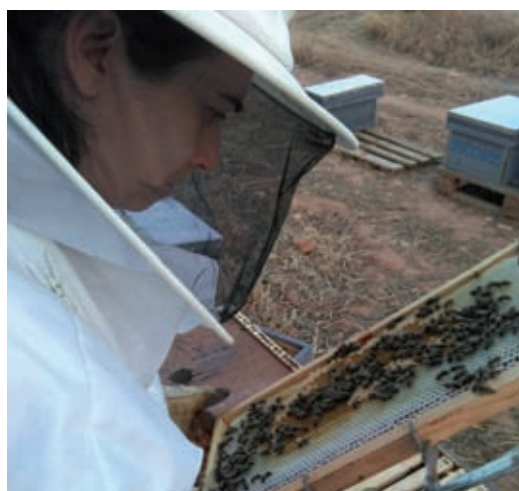
Figura 1. La formación del empresariado agrario es fundamental para mantener la rentabilidad de sus empresas

Esta unidad didáctica tiene dos objetivos claros. El primero de ellos es concienciar al empresariado agrario de la importancia de asumir por su parte esa labor empresarial. A pesar de las particularidades del sector agrario, y al igual que se realiza en otros sectores económicos, este colectivo debe conocer y saber gestionar adecuadamente sus explotaciones agrarias para asegurar la viabilidad económica de las mismas. En segundo lugar, se pretende poner a disposición del sector agrario, unos conceptos básicos sobre la rentabilidad económica de las inversiones, de manera que ello le permita realizar inversiones bien planificadas en un entorno cada vez más competitivo.