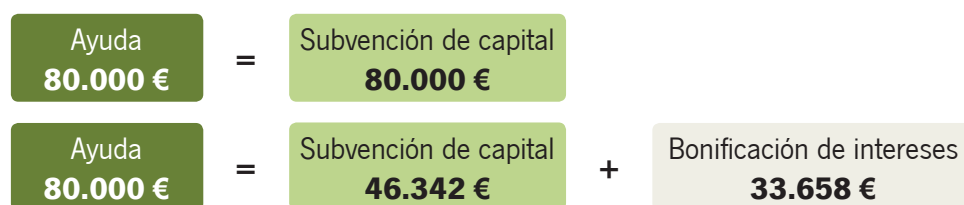
Figura 4. Ejemplo de una misma cuantía de ayuda en las dos modalidades posibles

La subvención podrá consistir en una ayuda directa o una ayuda directa más una bonificación de intereses. En este caso, la cuantía de la ayuda directa será la resultante de restar la ayuda en forma de bonificación de intereses de la subvención que se otorgue.