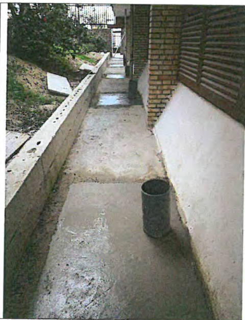
Tapado de huecos