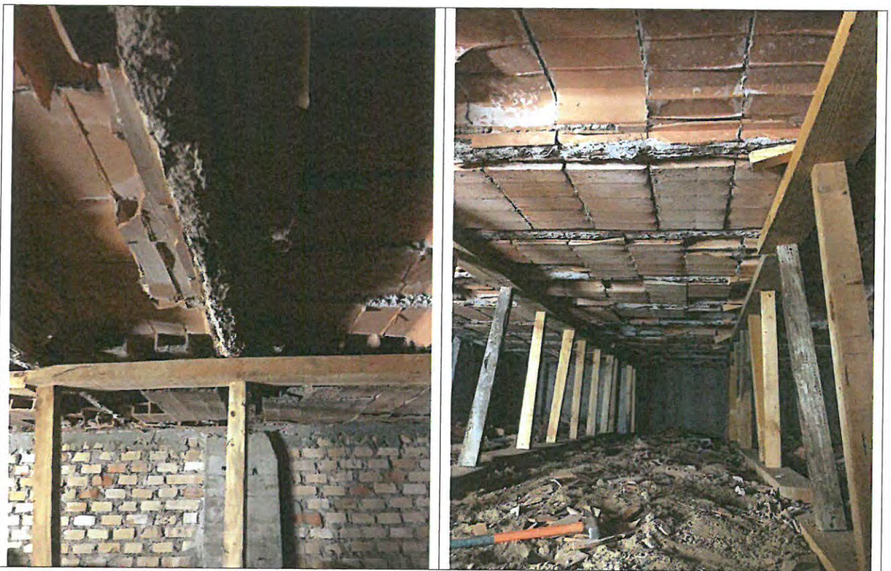
Apuntalamiento de forjado

El apuntalamiento del forjado se ha realizado colocando un tablón apoyado en el suelo y otro en contacto con el forjado, colocados de modo transversal a las viguetas, dos por vano; entre tablonos se colocan puntales de madera cortados a la longitud adecuada a la separación entre tablonos y acuñados para que ejerzan presión en los tablonos. En la zona en la que coloquen los tablonos de apoyo en el suelo se limpiarán de restos de bovedillas y escombros para crear una superficie homogénea de apoyo.