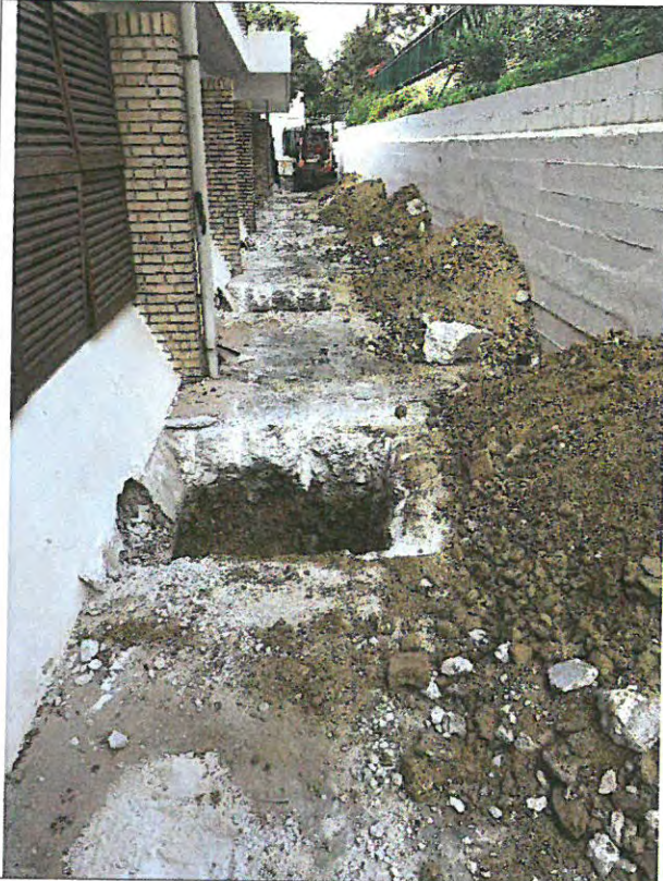
Ejecución de huecos para ventilación