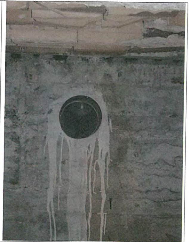
Taladro desde el interior de la cámara sanitaria