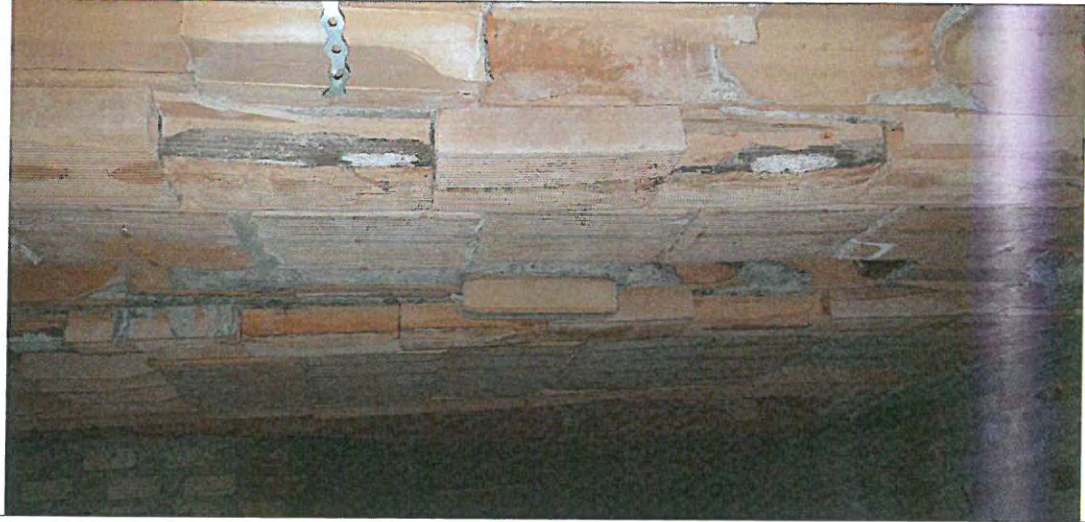
Foto 2 Detalle del estado del forjado.