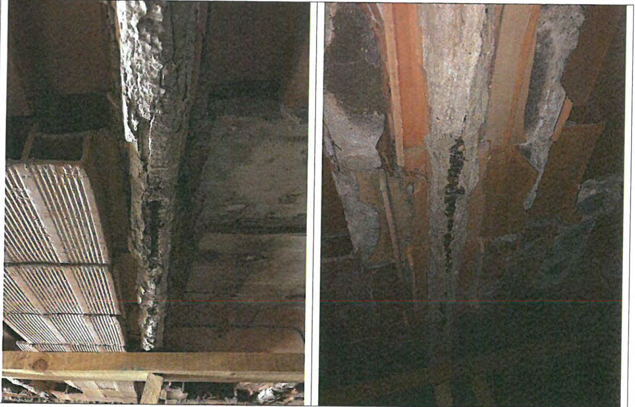
Estado de las armaduras en viguetas

La dimensión del nervio es de 7 cm de ancho