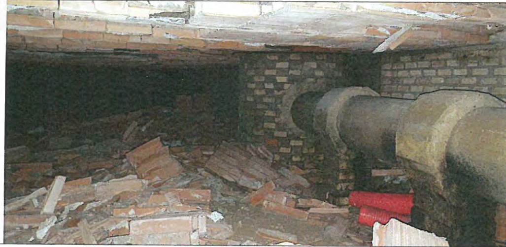
Foto 4 detalle de la conducción de saneamiento.

Se aprecia igualmente que la cámara sanitaria no dispone de ventilación.