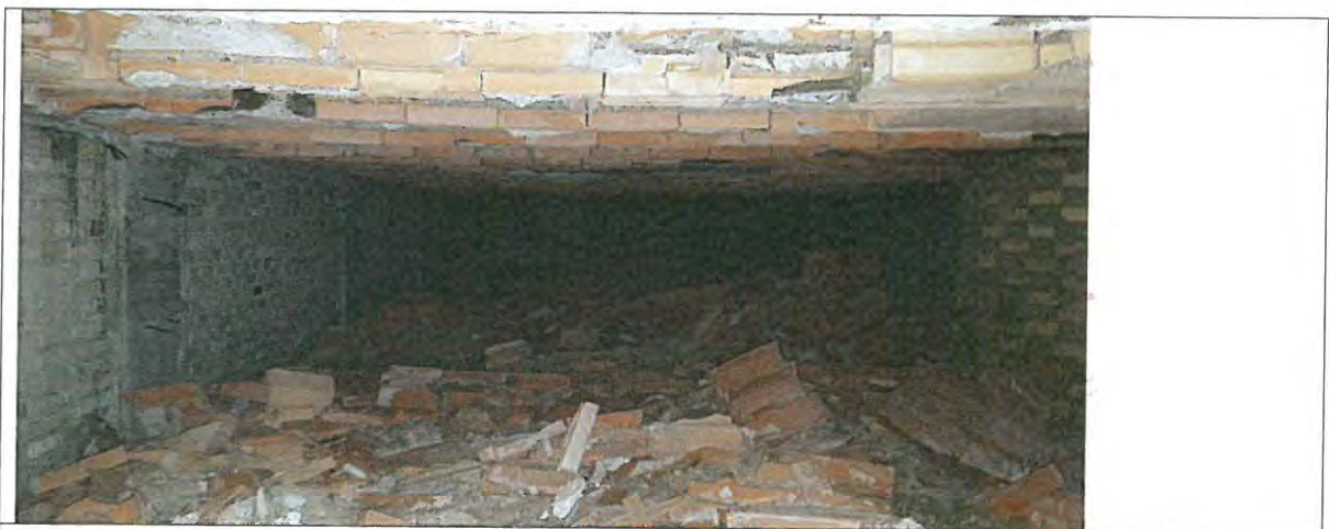
Foto 1 Configuración del forjado

Se observa que las bovedillas se han desprendido quedando el forjado como se aprecia en las imágenes siguientes.