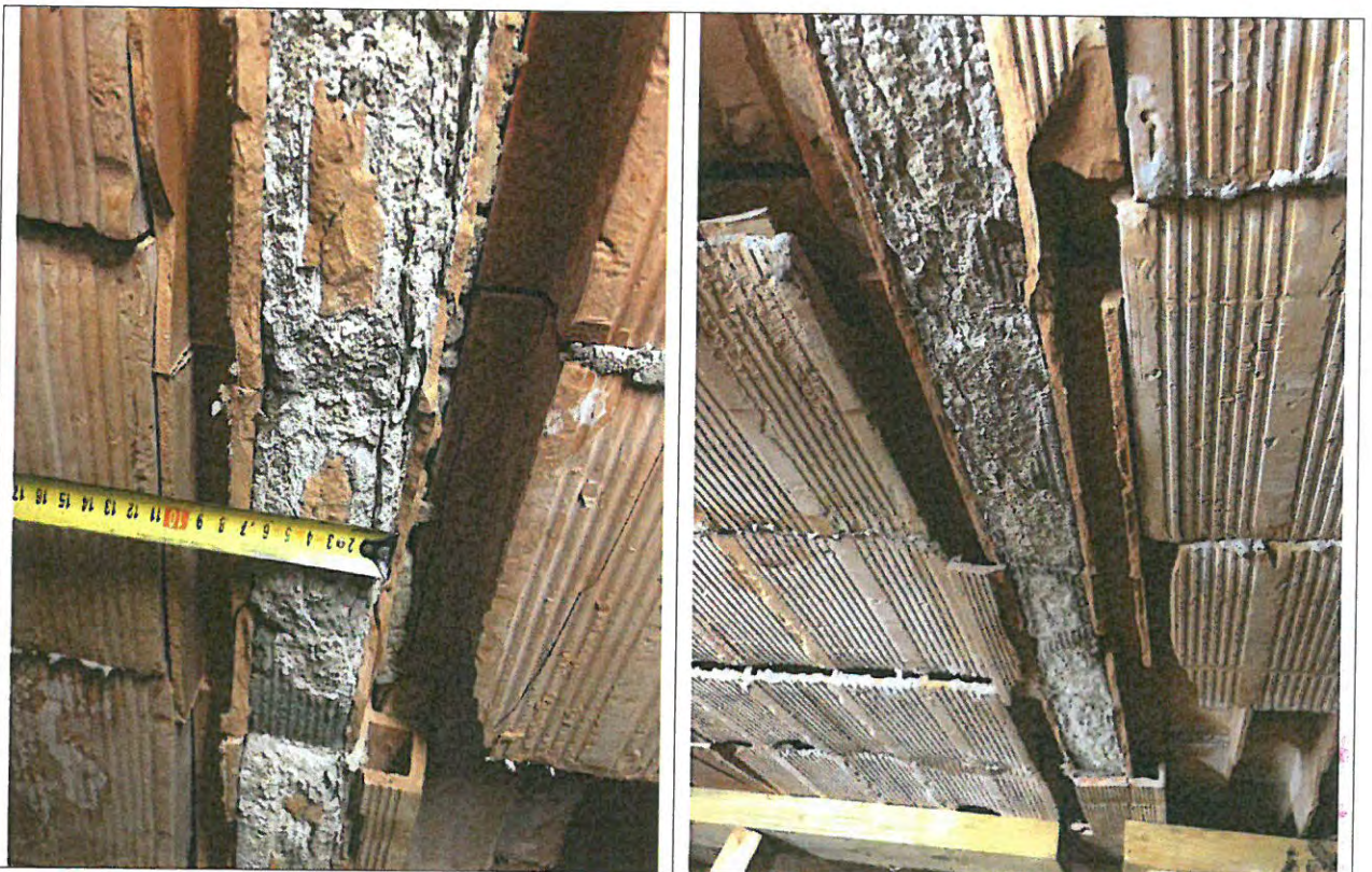
Dimensión del nervio

La dimensión del nervio es de 7 cm de ancho