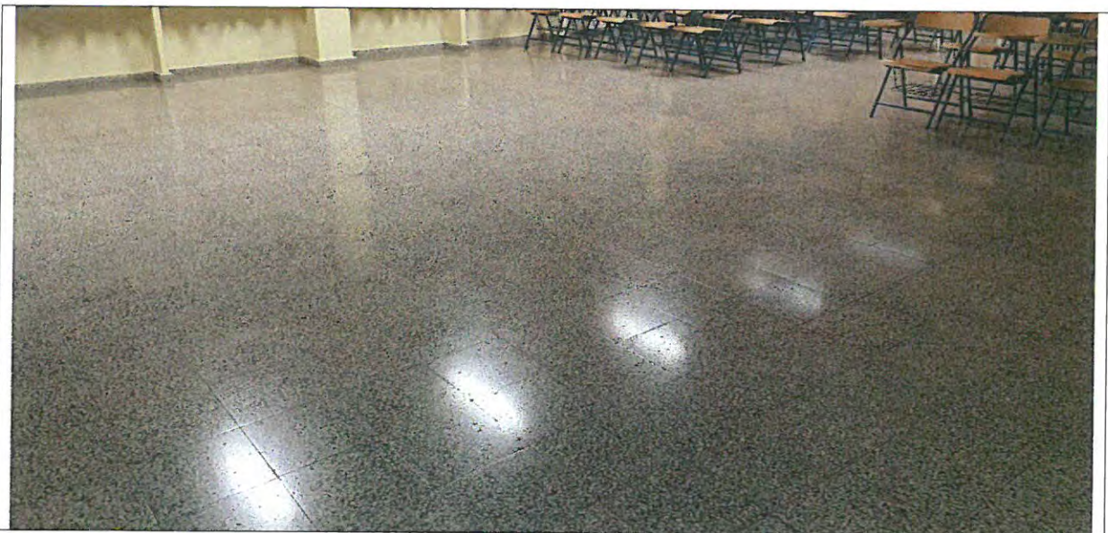
Estado de la solería

No se aprecian en la solería síntomas que indiquen la existencia de deformaciones excesivas en el forjado.