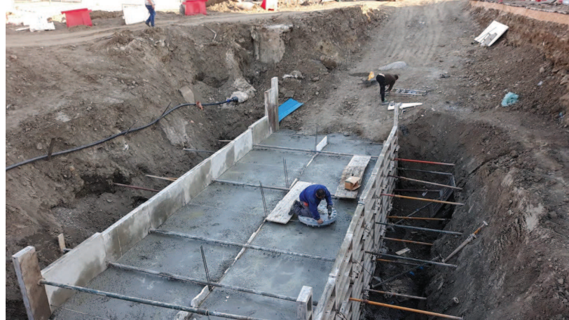
Recubrimiento de hormigón de la tubería y cierre de la boca de hombre