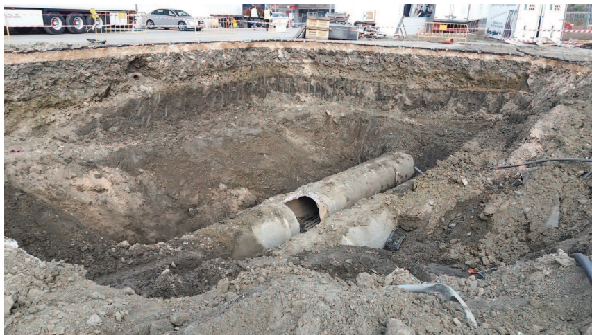
Excavación de descubrimiento de la Rotura en la tubería