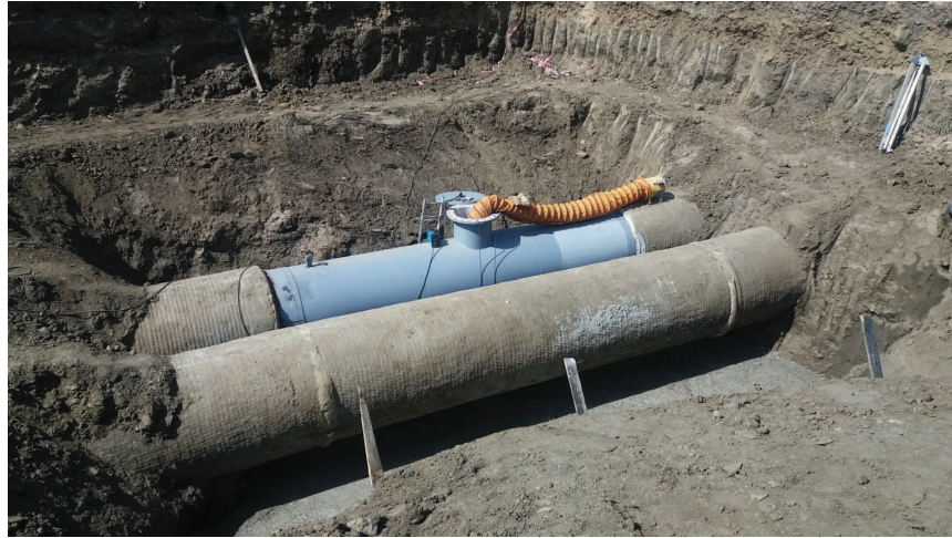
Terminando de colocar el nuevo tramo de tubería que sustituye al averiado