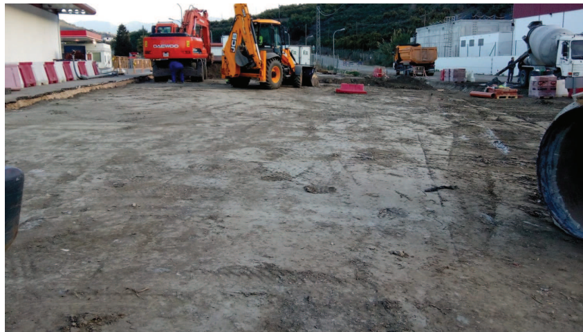
Relleno de la excavación convenientemente compactado

Código Seguro de verificación: eUh8aUvM8o407+YURk33Cg==. Permite la verificación de la integridad de una copia de este documento electrónico en la dirección: https://verifirma.agenciamedioambienteyagua.es Este documento incorpora firma electrónica reconocida de acuerdo a la Ley 59/2003, de 19 de diciembre, de firma electrónica.