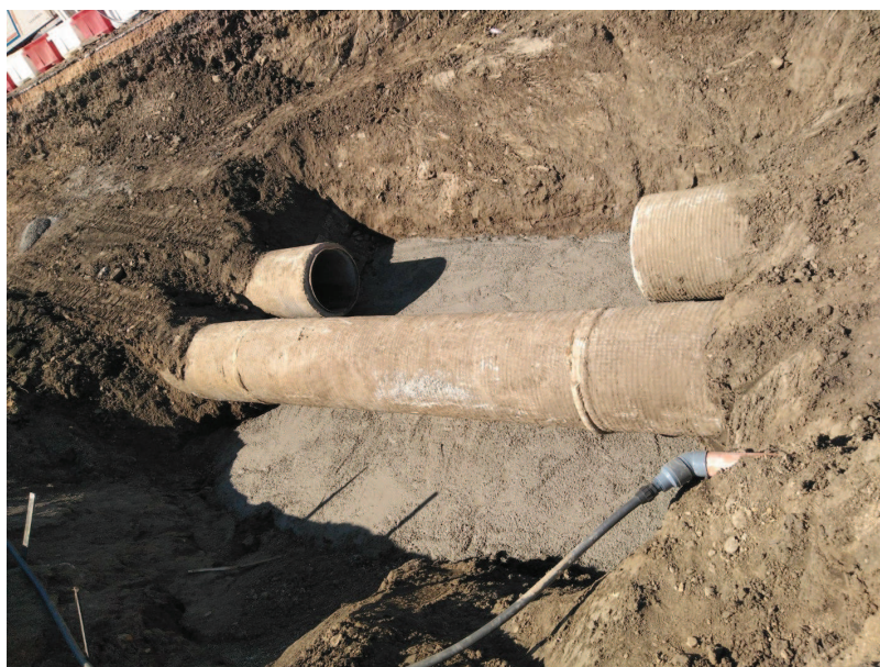
Conducción existente preparada para colocar el nuevo tramo de tubería

Código Seguro de verificación: eUh8aUvM8o407+YURk33Cg==. Permite la verificación de la integridad de una copia de este documento electrónico en la dirección: https://verifirma.agenciamedioambienteyagua.es Este documento incorpora firma electrónica reconocida de acuerdo a la Ley 59/2003, de 19 de diciembre, de firma electrónica.