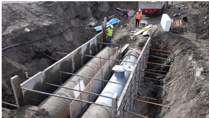
Encofrado para el recubrimiento de protección de hormigón para la tubería

Código Seguro de verificación: eUh8aUvM8o407+YURk33Cg==. Permite la verificación de la integridad de una copia de este documento electrónico en la dirección: https://verifirma.agenciamedioambienteyagua.es Este documento incorpora firma electrónica reconocida de acuerdo a la Ley 59/2003, de 19 de diciembre, de firma electrónica.