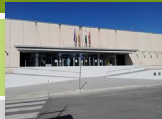
Fachada principal Ciudad Deportiva Juan Carlos I

Ejecución de una pequeña red de calefacción y refrigeración de distrito.