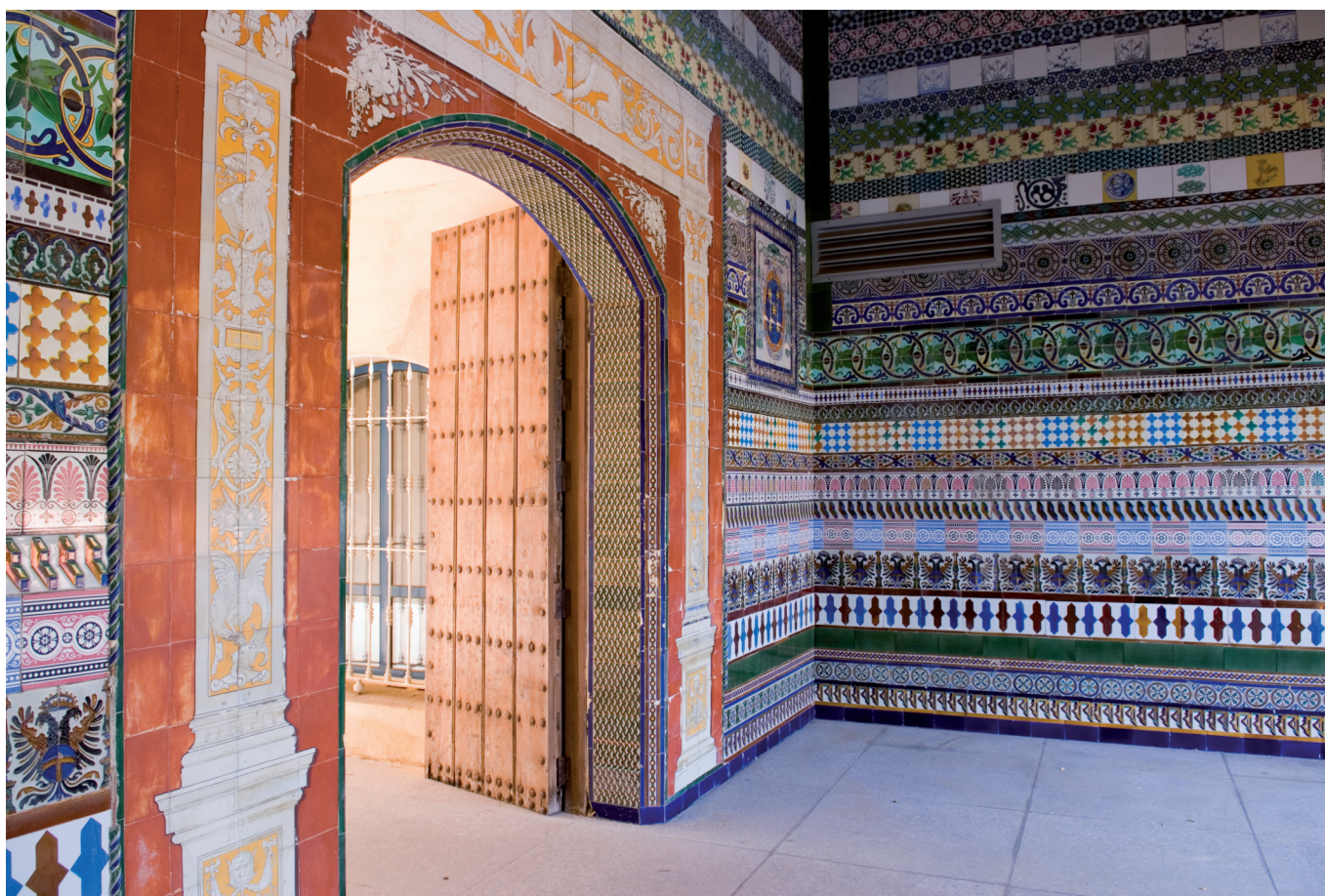
Monasterio de la Cartuja de Sevilla

para investigar más o abrirnos a nuevos métodos. Y, sobre todo, no debemos olvidarnos de dónde estamos y en qué situación estamos. Somos sensibles a la situación de Andalucía y tenemos que hacer nuestra aportación a temas sociales como la reinserción, el empleo... Investigar para aplicar a una realidad que vive Andalucía. Se habla mucho de industrias culturales, pero en esta situación tenemos que esforzarnos por reinsertarnos en este terreno. El IAPH, por su responsabilidad como ente público, tiene que estar atento al contexto donde desarrolla su trabajo.