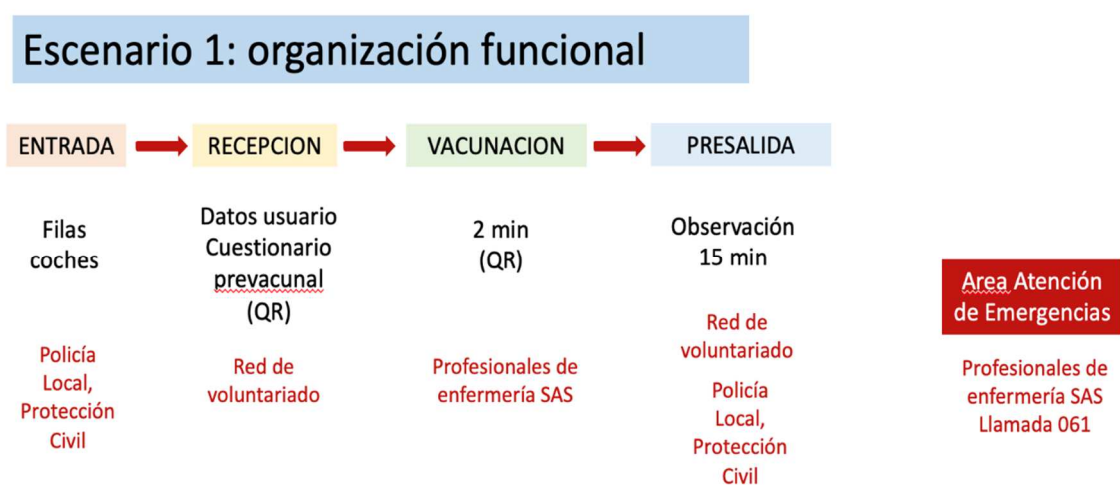
Figura 1. Organización funcional esquemática del Escenario 1