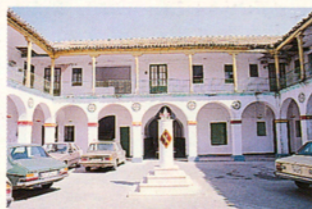
Fachada delantera, trasera y patio antes de la obra