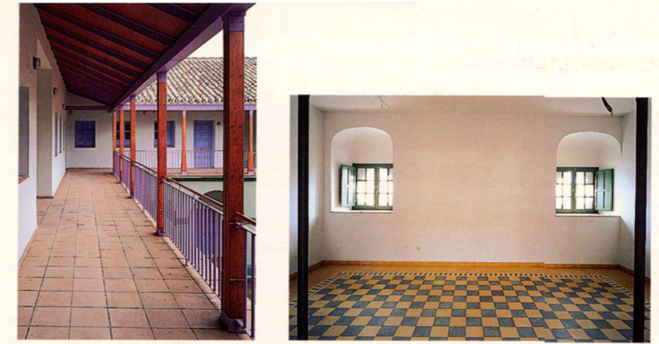
Vista de la galería e interior de una vivienda con el pavimento original recuperado

El edificio se encontraba, en el momento de acometer la intervención, en un estado considerable de deterioro, tanto en las estructuras de madera y en las cubiertas como en los elementos de tabiquería, instalaciones, carpinterías, cerrajería, etc.