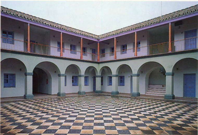
Vista del patio después de la obra