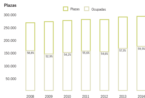
[ GRÁFICO ] Evolución del número de plazas y del grado de ocupación en los establecimientos hoteleros de Andalucía. Septiembre 2008-2014

Fuente: Encuesta de Ocupación Hotelera. INE