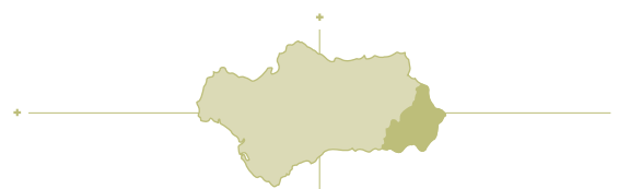
[ Almería ]