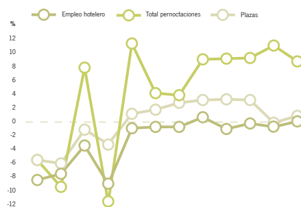
[ GRÁFICO ] Tasas de variación del empleo, las plazas y las pernoctaciones registradas en establecimientos hoteleros de Andalucía. Año 2013