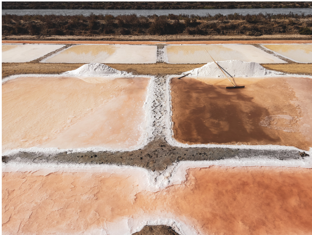
"MARISMA Y SALINA" . CHICLANA DE LA FRONTERA (CÁDIZ).