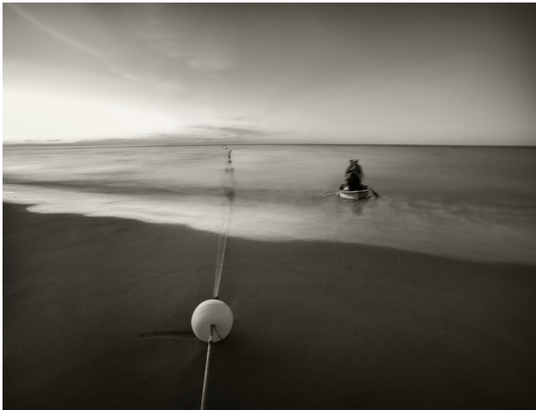
"PESCADORES AL ALBA" . ISLA CRISTINA (HUELVA).