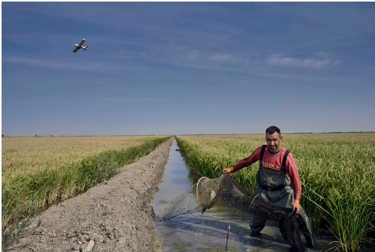
"EL ARROZ Y LA PESCA DEL CANGREJO ROJO". ISLA MAYOR (SEVILLA).