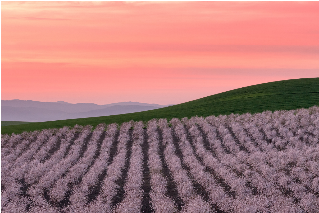
"ATARDECER ENTRE ALMENDROS EN FLOR" . CÓRDOBA.