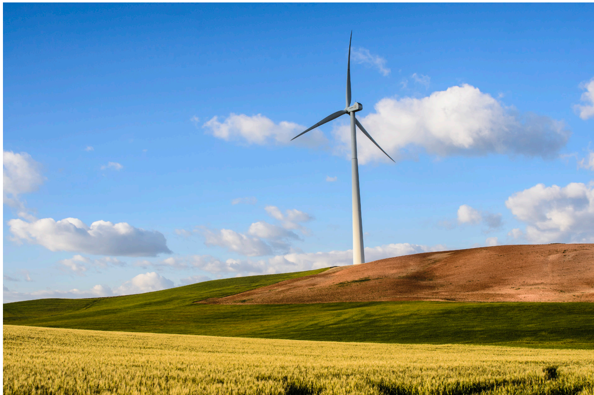
" AGRICULTURA Y ECOLOGISMO ". TEBAS (MÁLAGA).