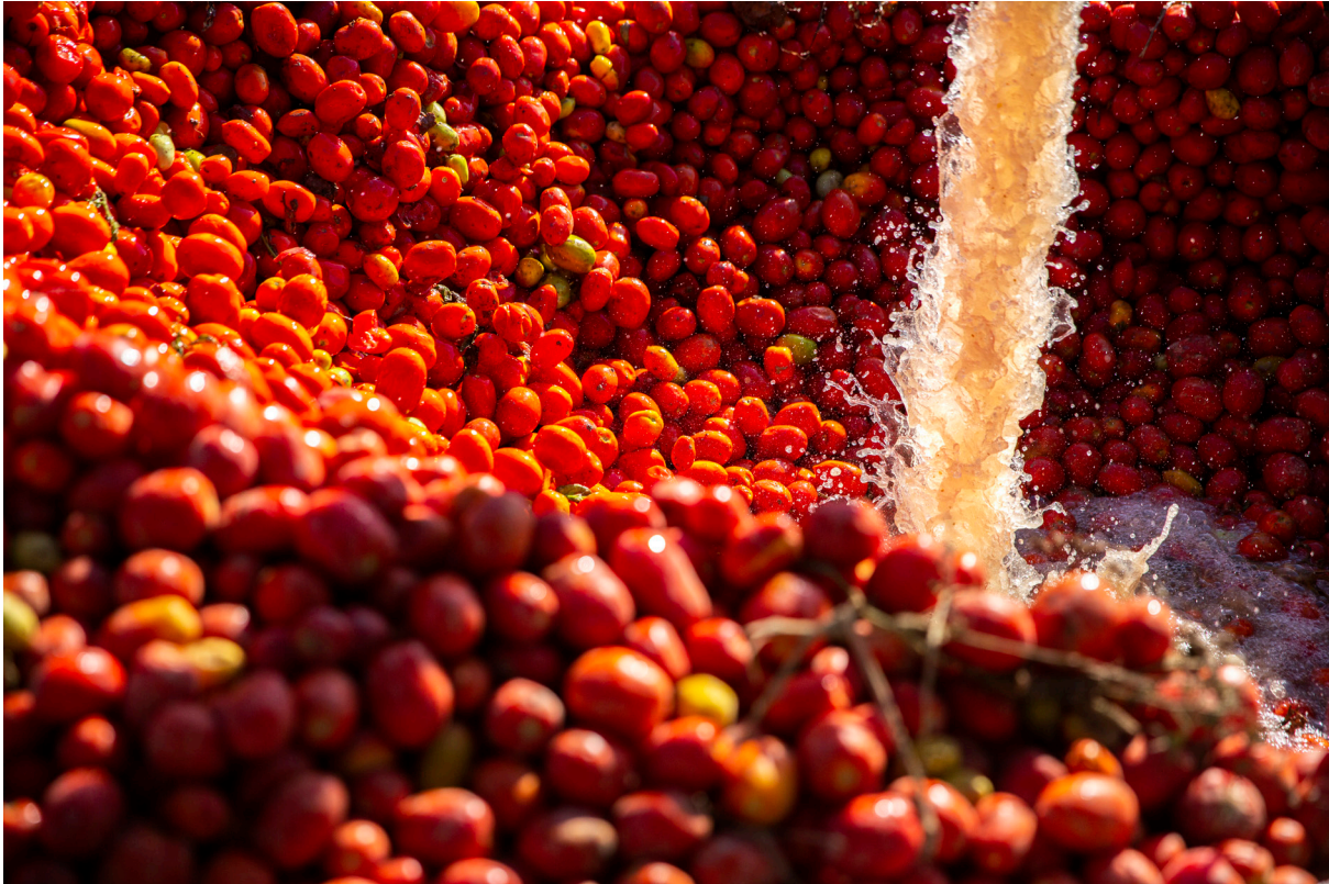
"PISCINA AL TOMATE". LEBRIJA (SEVILLA).