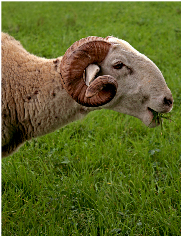
"PERFIL". LA ZUBIA (GRANADA).