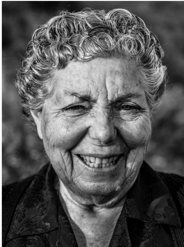
"MUJERES DE LA ALPUJARRA". SORVILÁN (GRANADA).