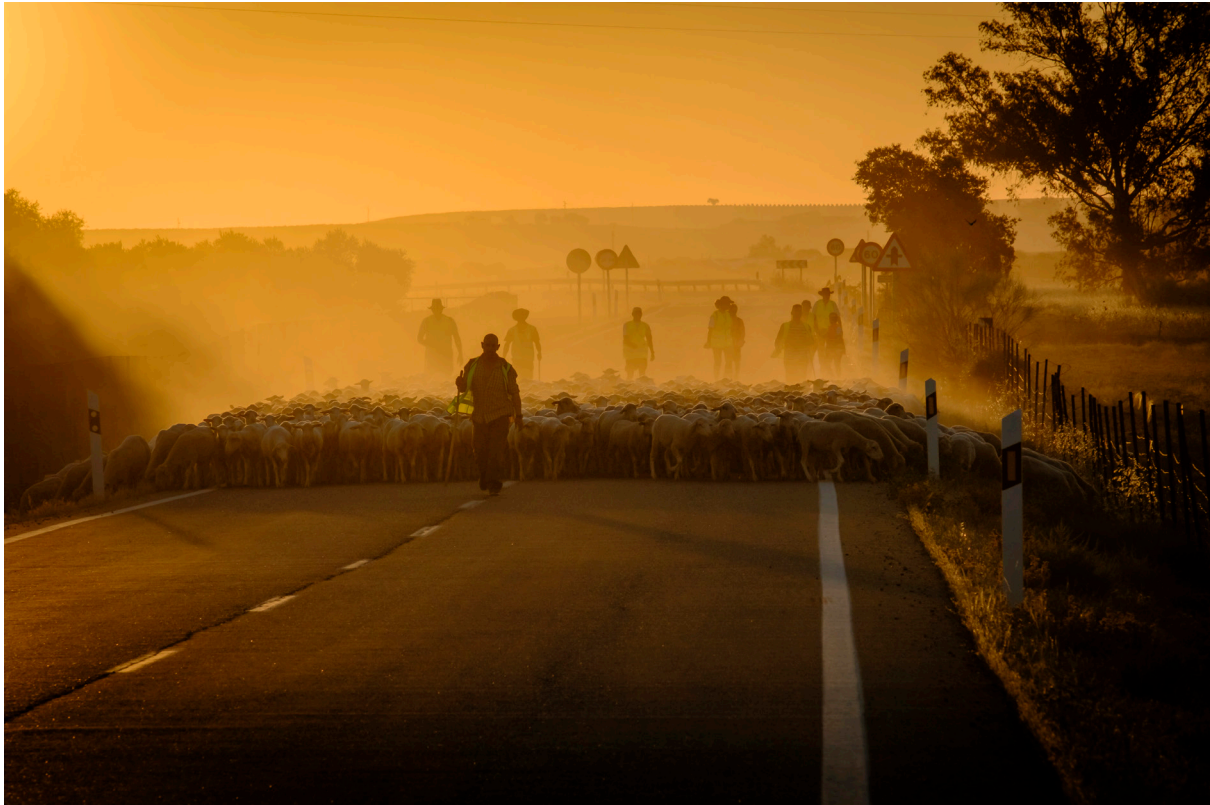
"TRASHUMANCIA AL AMANECER (UN VIAJE HACIA LOS RASTROJOS DEL VERANO)". GUADALCÁZAR (CÓRDOBA).