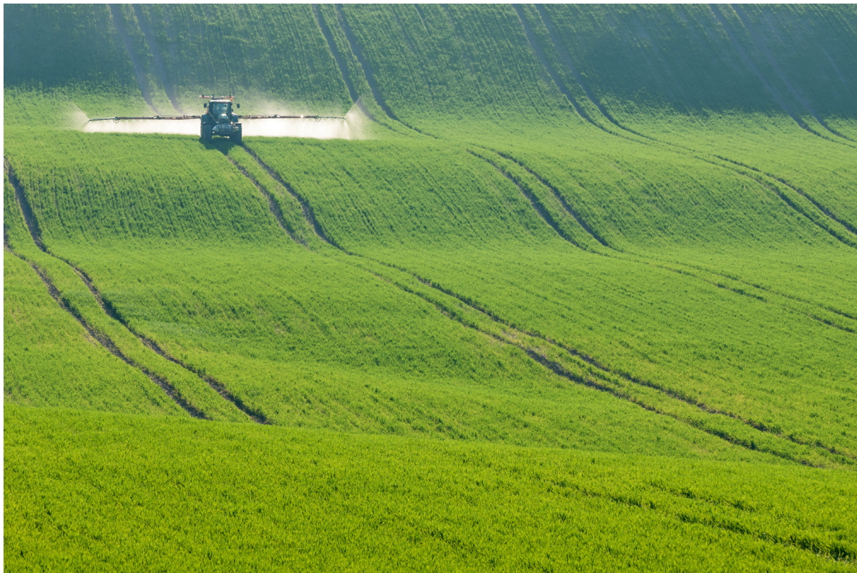
"SURCANDO OLAS DE CEREAL". CÓRDOBA.