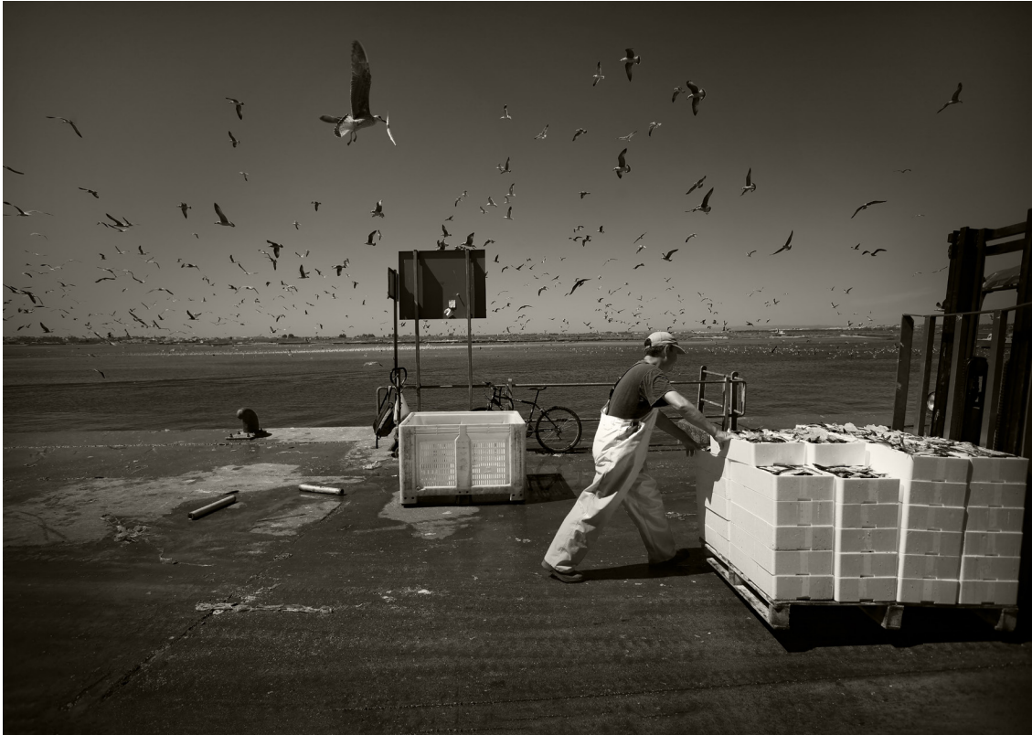
"SARDINAS FRESCAS". ISLA CRISTINA (HUELVA).