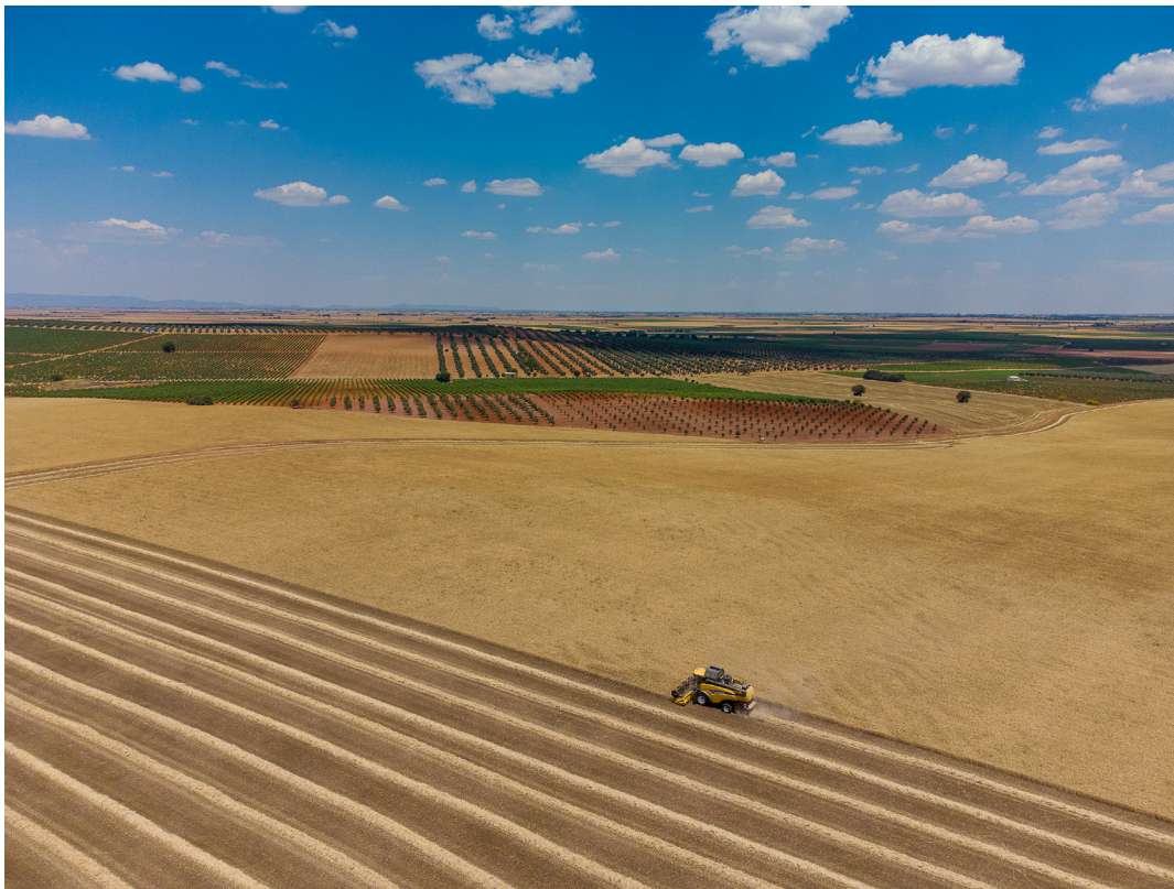
"CAMPOS DE CARMONA" . CARMONA (SEVILLA).