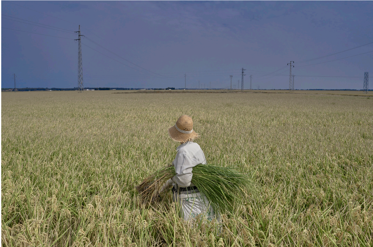
"QUITANDO LAS COLAS". ISLA MAYOR (SEVILLA).