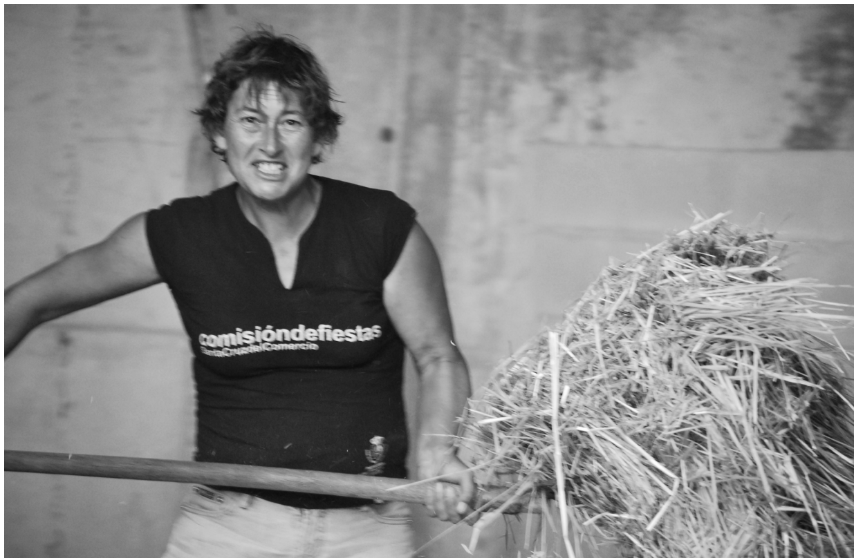
"ANICA" . SANTA CRUZ (GRANADA).