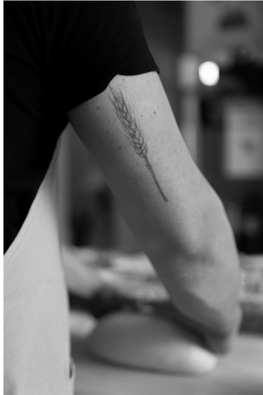
"ESPIGA". NIGÜELAS (GRANADA).