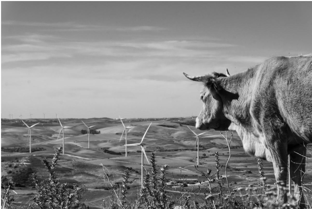
"HASTA DONDE LA VISTA ALCANZA" . JEREZ DE LA FRONTERA (CÁDIZ).