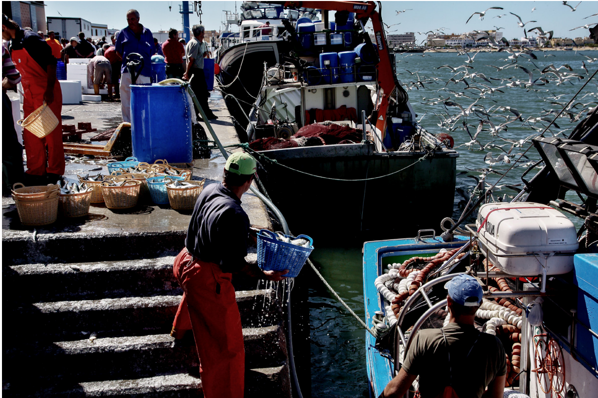
"LA DESCARGA" . ISLA CRISTINA (HUELVA).