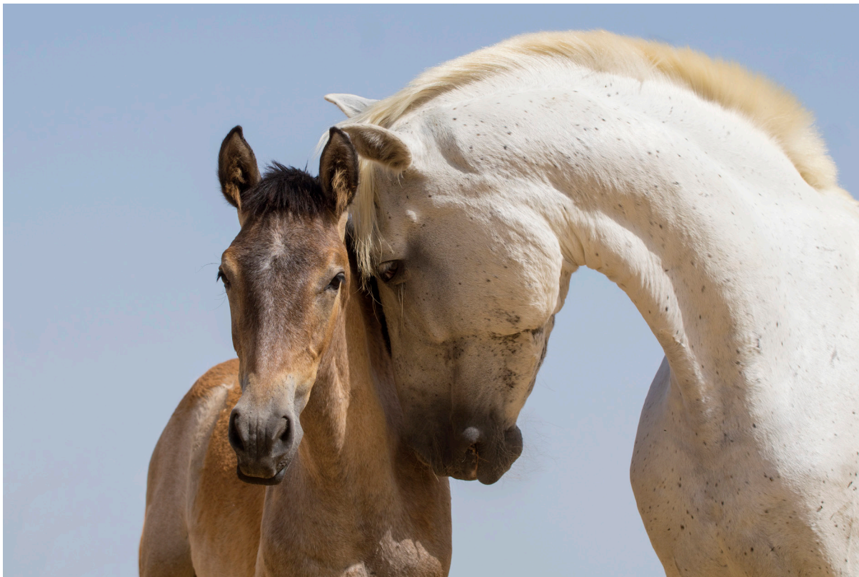
"AMOR DE MADRE" . JEREZ DE LA FRONTERA (CÁDIZ).