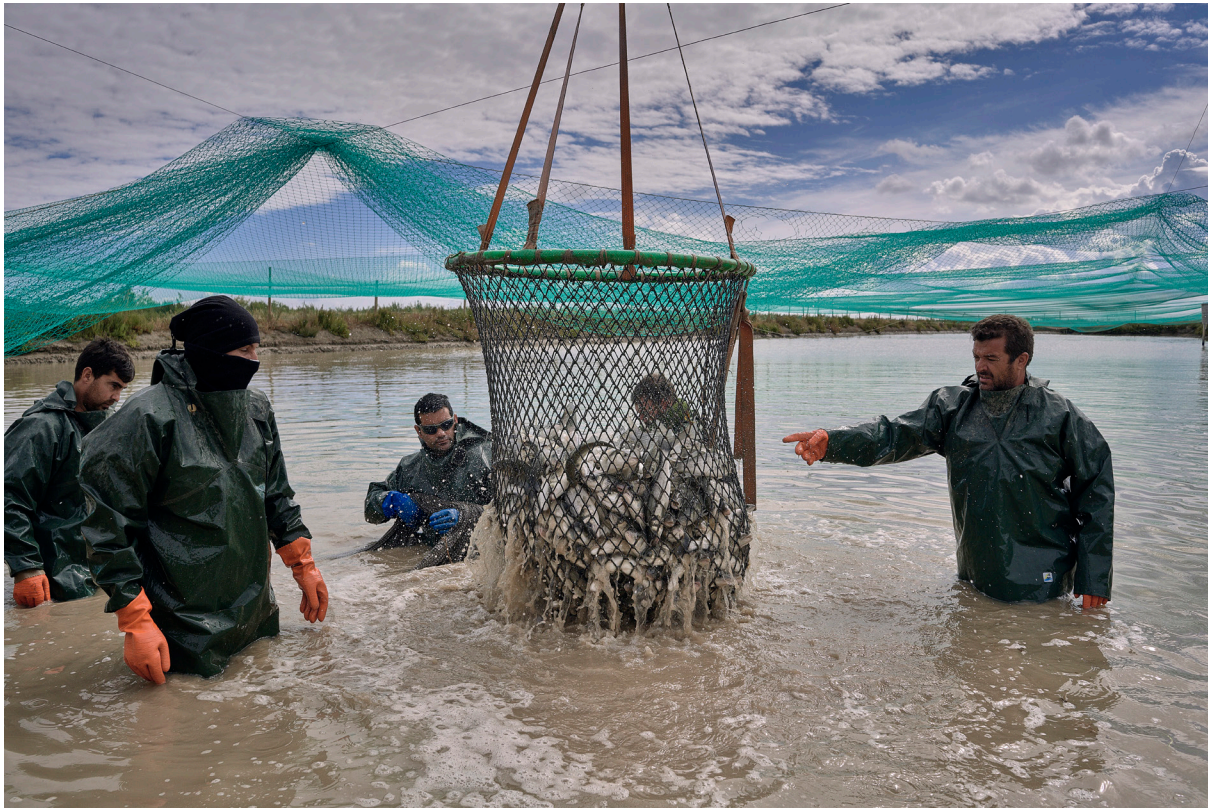
"ACUICULTURA, ESTEROS VETA LA PALMA". ISLA MAYOR (SEVILLA).