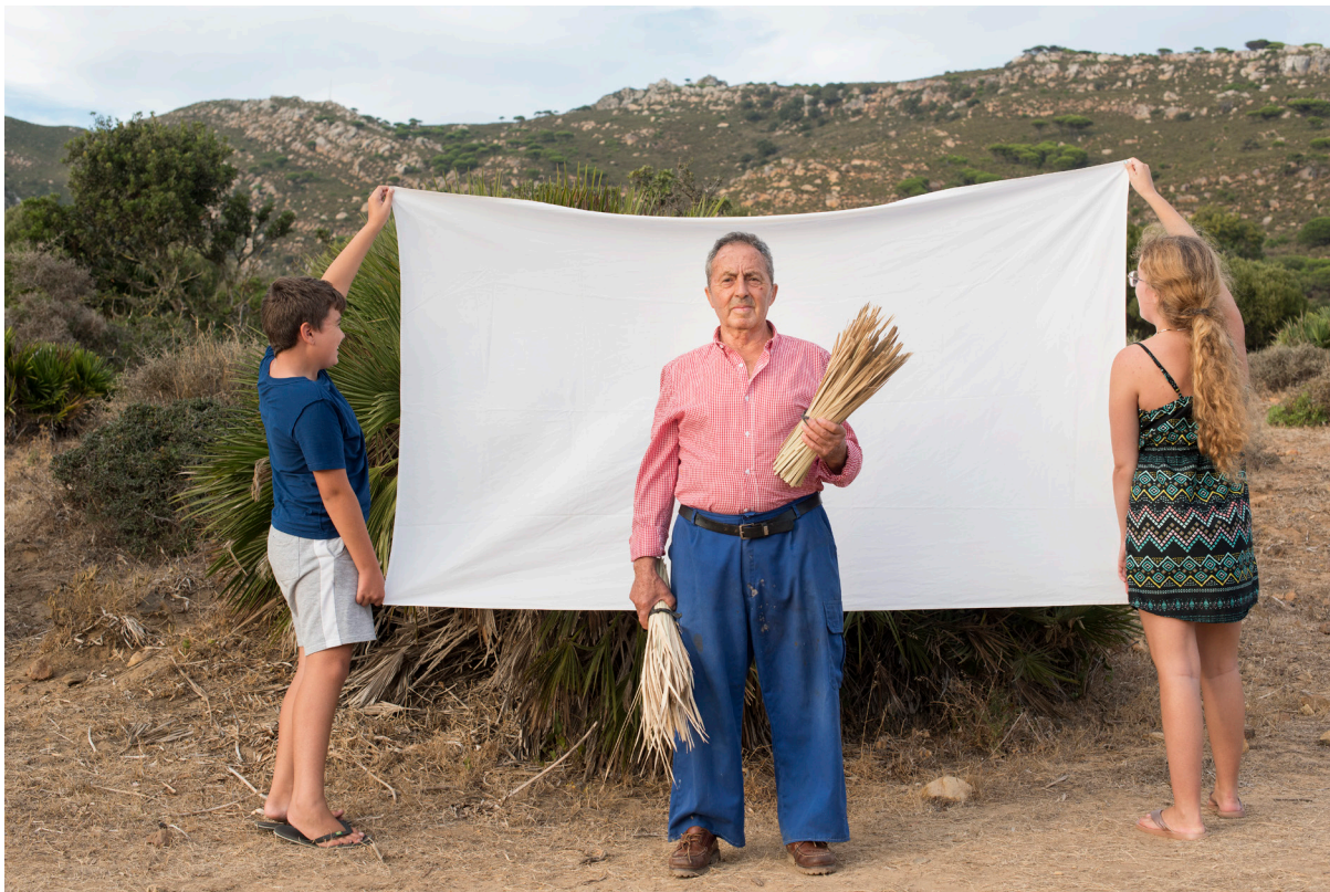
"EL ABUELO CESTERO I". TARIFA (CÁDIZ).