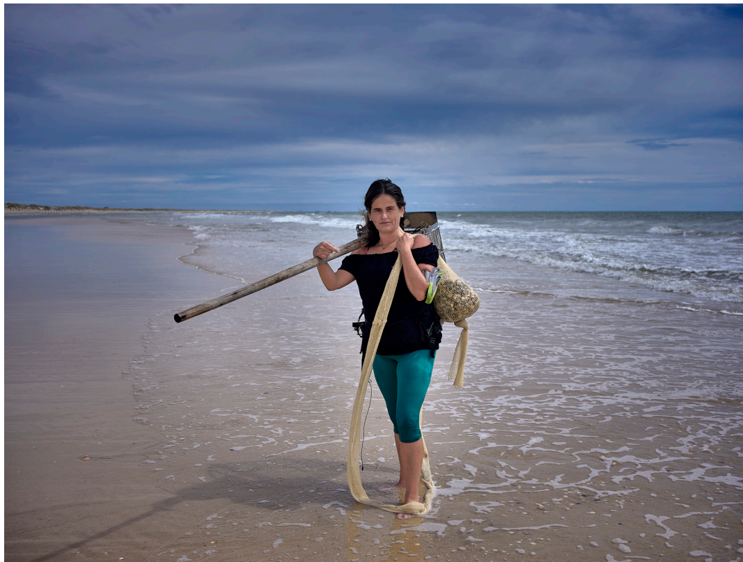
"MARISCADORA" . MATALASCAÑAS (HUELVA).