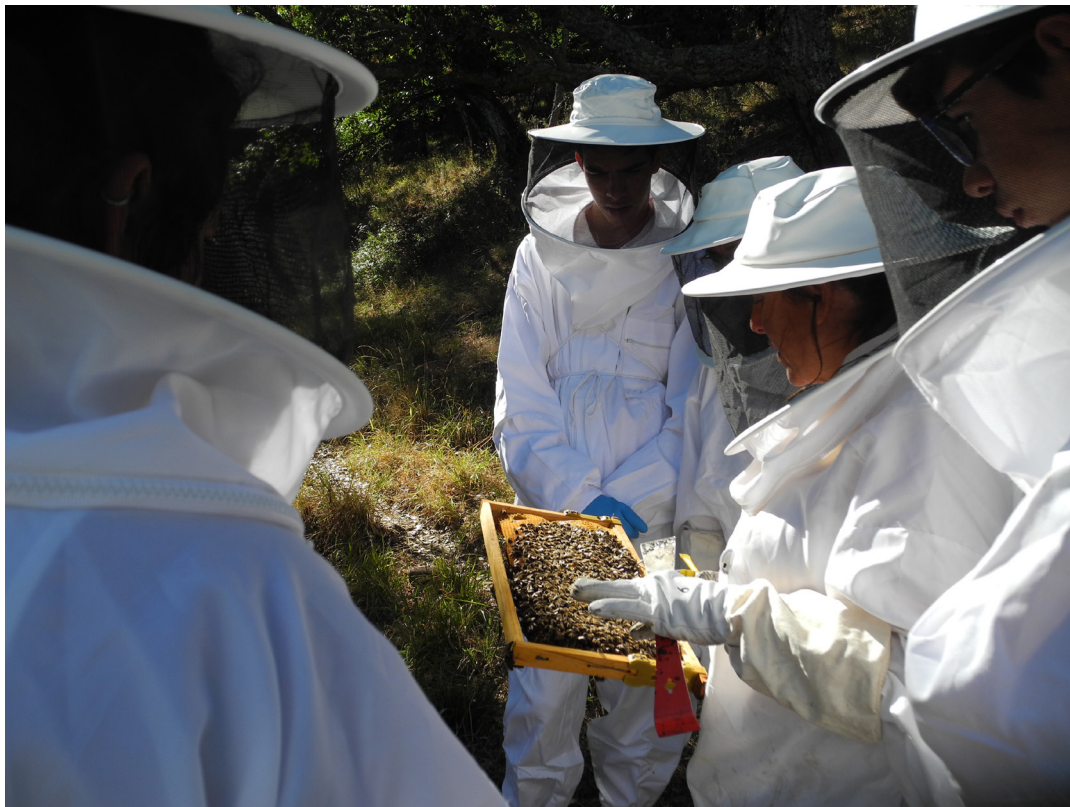
"ABELLAS". CASTAÑUELO (HUELVA).