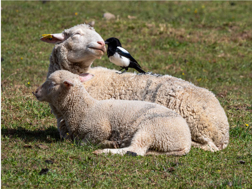
"¿NO ME DIGAS?". CARDEÑA (CÓRDOBA).