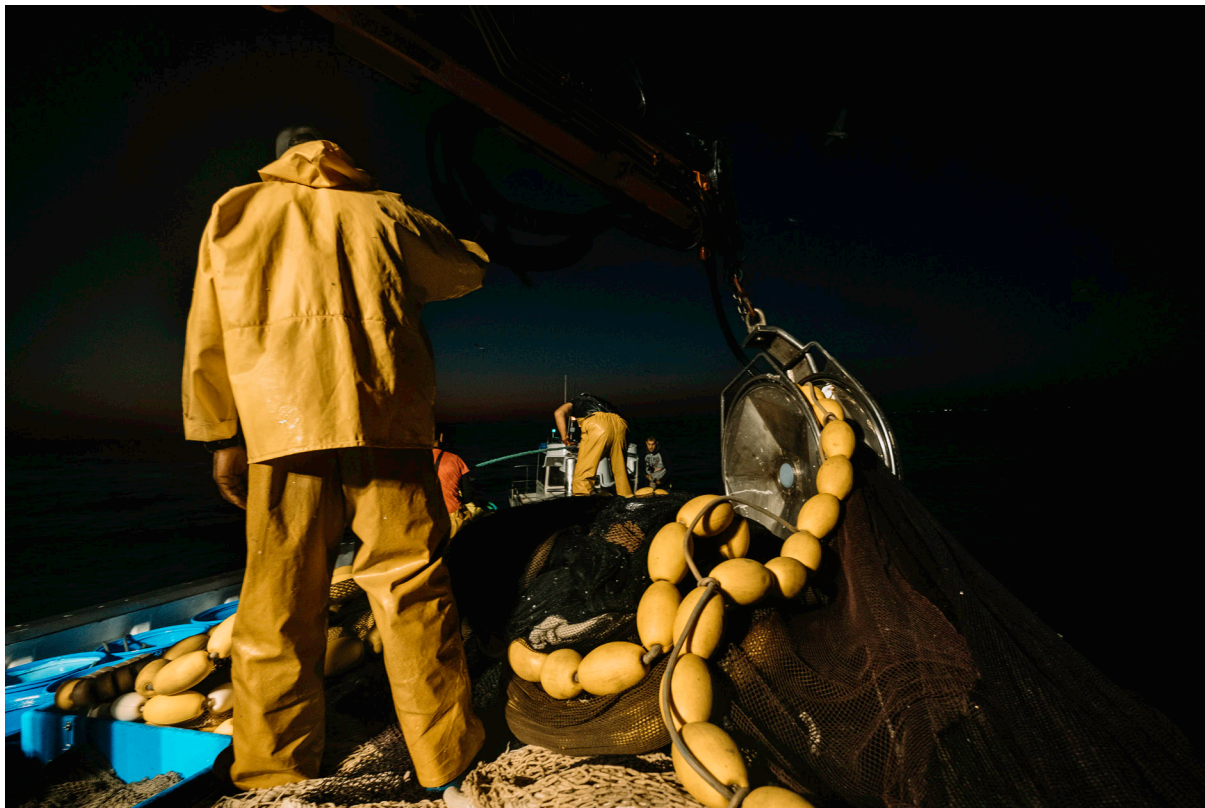
"RUTAS MARINERAS - CERCO V". ISLA CRISTINA (HUELVA).