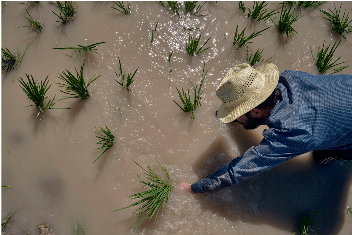
"REPLANTANDO ARROZ" . ISLA MAYOR (SEVILLA).