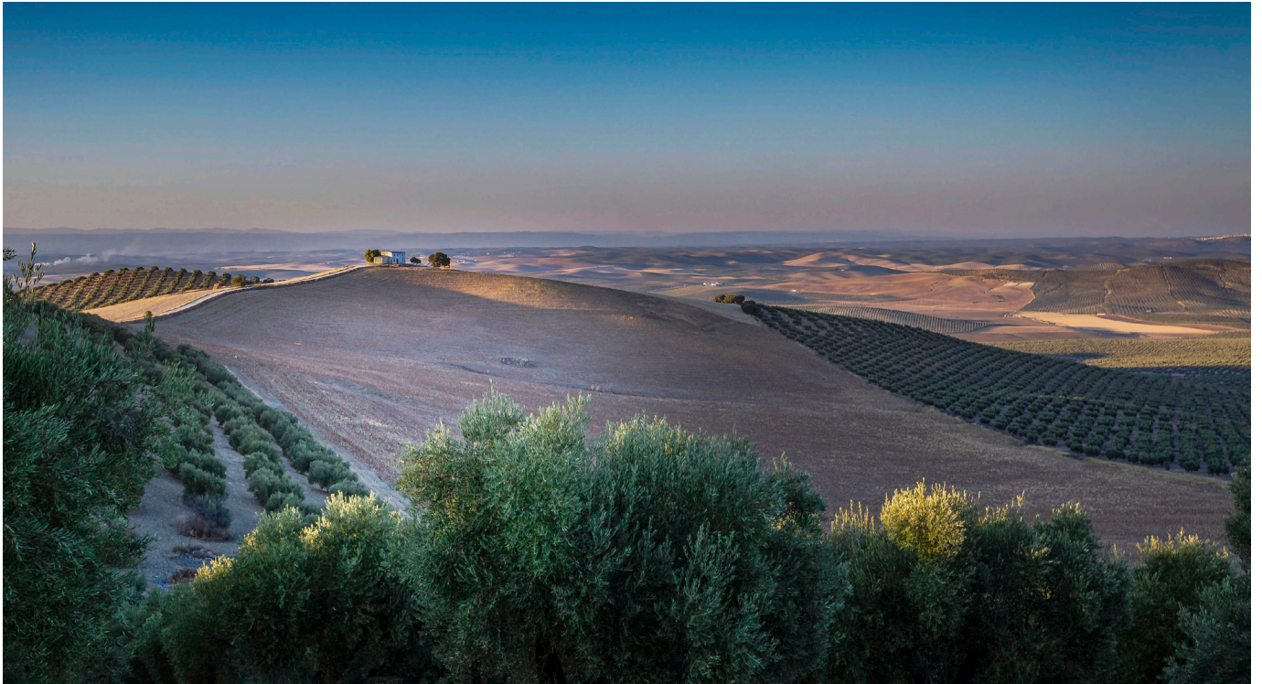
"CAMPOS DE CASTRO". CASTRO DEL RÍO (CÓRDOBA).