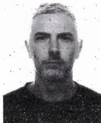
Fotografía del titular Photograph of the holder