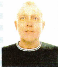
Fotografía del titular Photograph of the holder