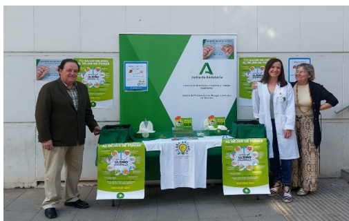
Día Mundial del Tabaco. 31 de mayo de 2024