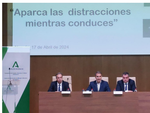
Jornada de Seguridad Vial en Almería. 17 de abril de 2024