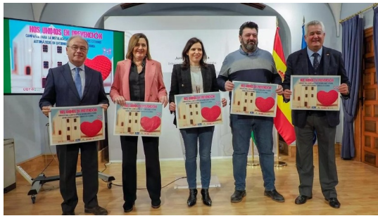
Presentación de la Campaña para la instalación de desfibriladores externos automáticos en entornos laborales de Córdoba