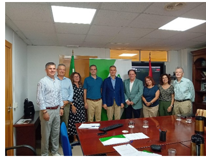
Reunión Comisión Provincial Almería. 24 de julio de 2024