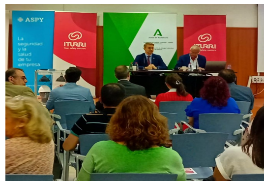
Jornada de Estrés Térmico 14 de mayo de 2024