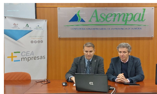
Reuniones provinciales con agentes económicos y sociales