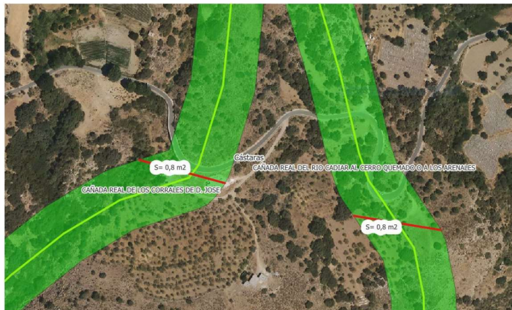
Imagen 1.- Afección a las Cañadas Reales.

trabajos de identificación realizados sobre dicha vía pecuaria, se ha realizado una estimación de deslinde de las vías pecuarias de la zona, que se observa en la siguiente imagen donde se representa el trazado del enlace bakchaul de fibra óptica (en rojo) junto con el trazado de las vías pecuarias (en verde):