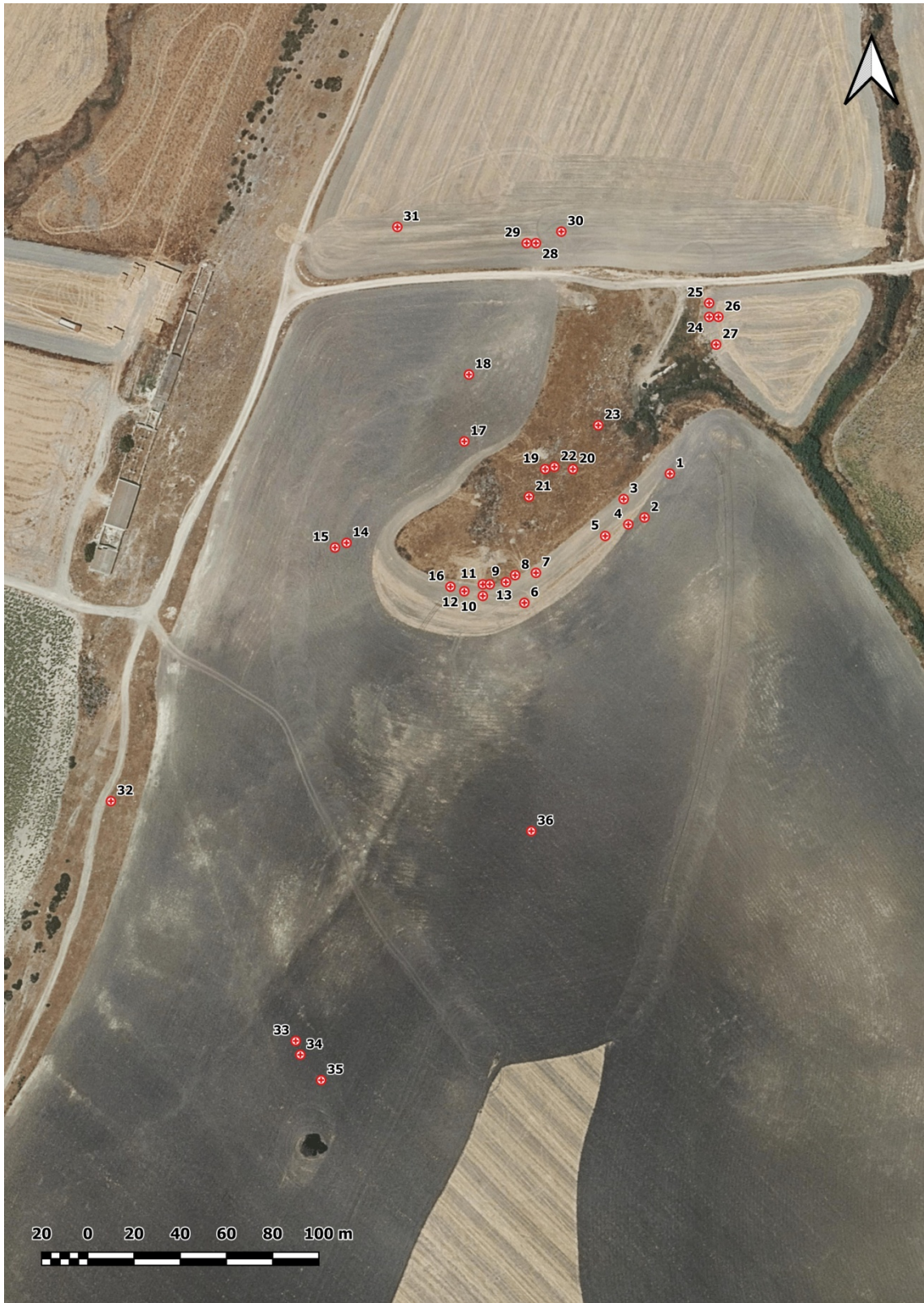
Planimetría generada con las evidencias localizadas en la prospección de la Finca San Antón (Espera, Cádiz).