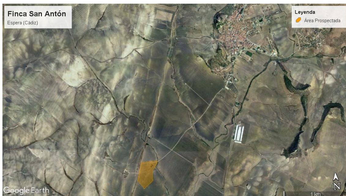
Localización de la zona a prospectar respecto al casco urbano de Espera.