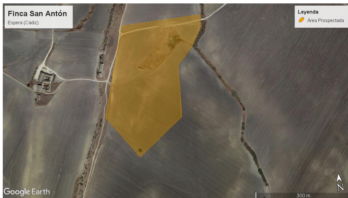
Área prospectada en la finca San Antón (Espera, Cádiz)