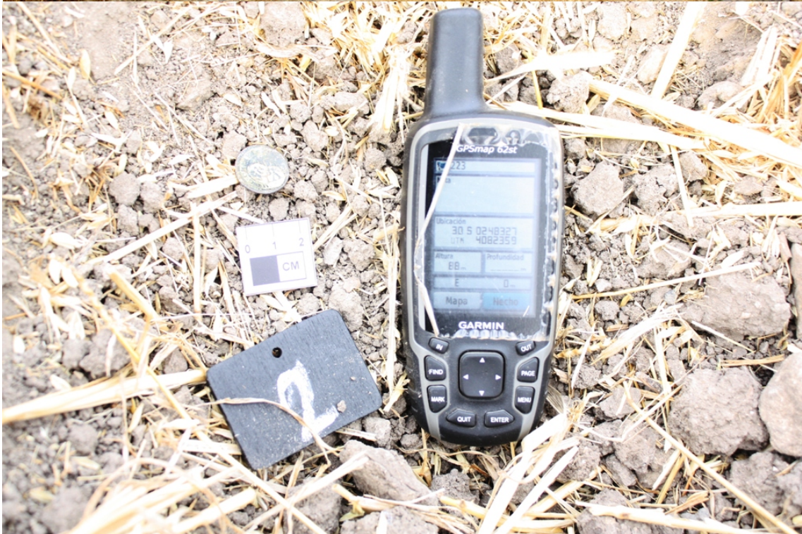
Labores de prospección y Georeferenciación de las evidencias localizadas durante la prospección.