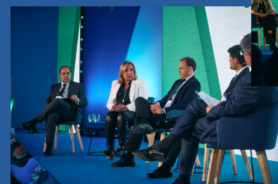
Una Andalucía más sostenible