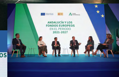
Una Andalucía más digital y competitiva