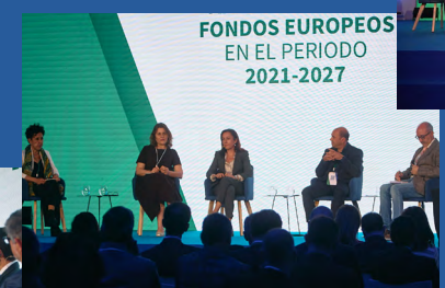
Una Andalucía más social