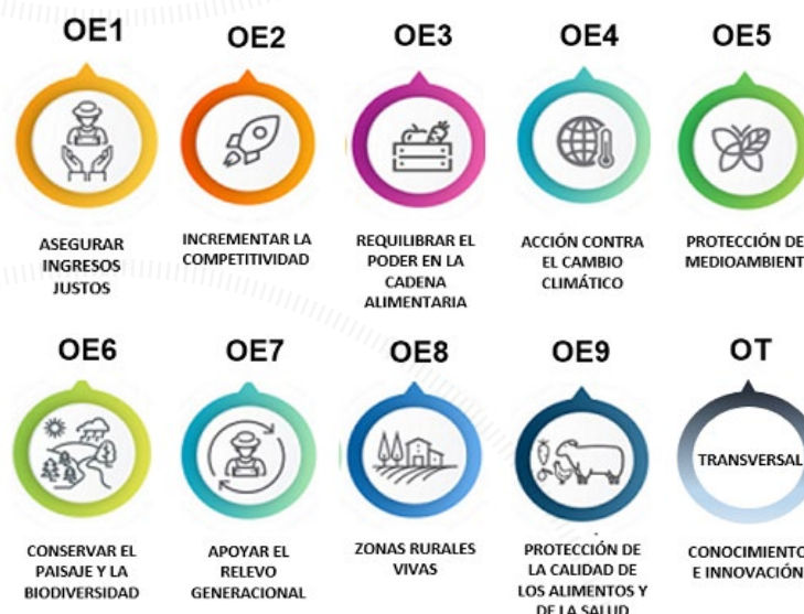
Figura 2. Objetivos específicos del nuevo modelo de PAC 2023-2207.

8. Asimismo, la política agrícola común (PAC) 2023-2027 incluye más condiciona- lidad para beneficiarse de las ayudas (garantía de rentas agrarias), sea en lo social (ésta entra en vigor en enero de 2024) sea, sobre todo, en lo ambiental. El nuevo plan estratégico de la PAC dice que busca simplificar la regulación y gestión agrarias de la UE, de modo que se ponga énfasis menos en las normas y su cumplimiento burocrático y mucho más en la consecución de resultados y rendimientos, para satisfacer las necesidades económicas, sociales y medioambientales, en constante evolución de un mundo globalizado. Pero la percepción más difundida en el sector es que, una vez más, se carga sobre el sector agrario responsabilidades ambientales que, además de ser más significativas en otros sectores económicos, cuya actividad no se condiciona tanto, van en detrimento de su propio futuro, y el de sus familias, por la mayor incertidumbre sobre la rentabilidad de sus producciones, haciéndose menos atractiva también para la juventud. Como siempre, la llamada a la modernización del sector pasa más por su digitalización, innovación en lo tecnológico y en lo económico, mejora de la competitividad y menos por la garantía de un real bienestar integral, económico (garantía de una renta justa y suficiente) y psicosocial ( Figura 2 ).