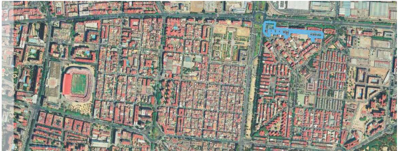
Localización del ERP en el municipio de Sevilla.

NAZARET - PAJARITOS - C/ CIGÜEÑA - SEVILLA DELIMITACIÓN DE ENTORNO RESIDENCIAL DE REHABILITACIÓN PROGRAMADA (ERP)