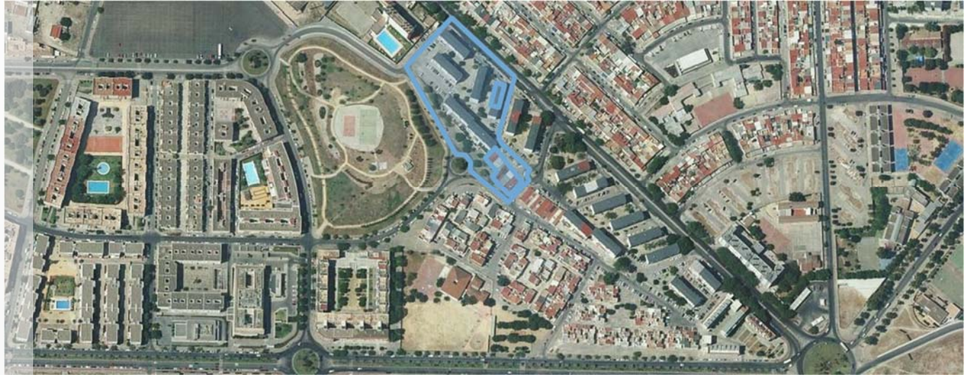
Localización del ERRP en el municipio de Jerez.

SANTO TOMÁS DE AQUINO NORTE - JEREZ DE LA FRONTERA | CÁDIZ DELIMITACIÓN DE ENTORNO RESIDENCIAL DE REHABILITACIÓN PROGRAMADA (ERRP)