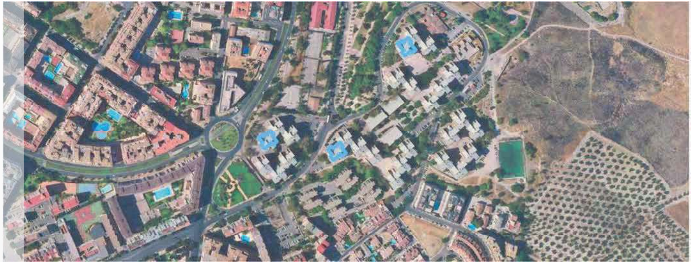
Localización del ERRP en el municipio de Jaén.

POLIGONO DEL VALLE - JAÉN DELIMITACIÓN DE ENTORNO RESIDENCIAL DE REHABILITACIÓN PROGRAMADA (ERRP)