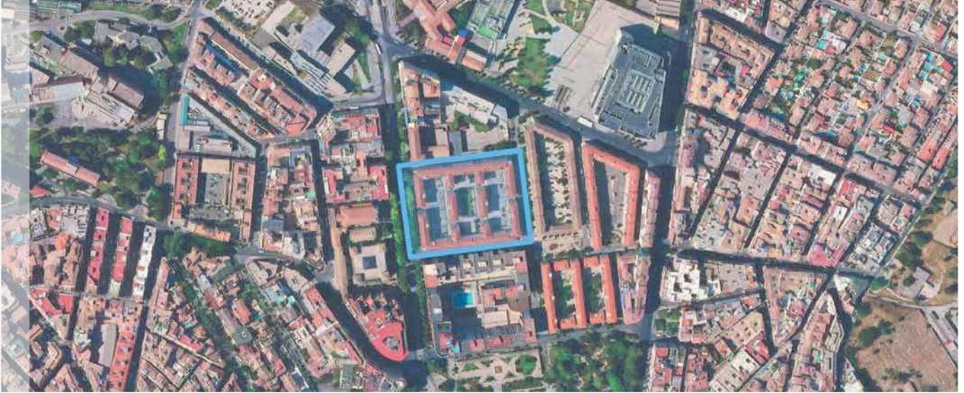
Localización del ERRP en el municipio de Jaén.