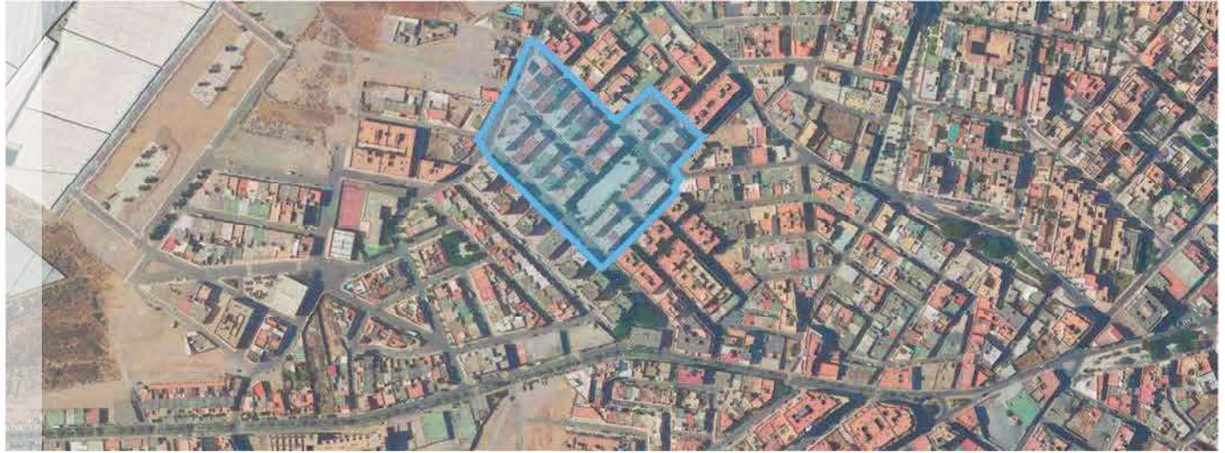
Localización del ERRP en el municipio de Roquetas de Mar.

ENTORNO PZ. DE ANDALUCÍA - ROQUETAS DE MAR | ALMERÍA DELIMITACIÓN DE ENTORNO RESIDENCIAL DE REHABILITACIÓN PROGRAMADA (ERRP)