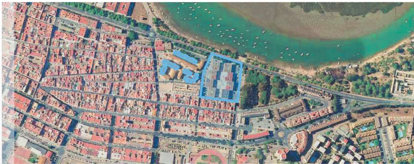
Localización del ERP en el municipio de Isla Cristina.

EL ROCÍO / JESÚS DEL GRAN PODER - ISLA CRISTINA | HUELVA DELIMITACIÓN DE ENTORNO RESIDENCIAL DE REHABILITACIÓN PROGRAMADA (ERP)