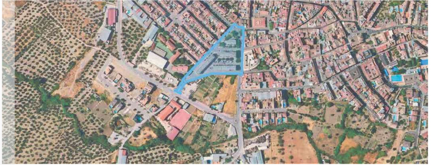
Localización del ERRP en el municipio de Jamilena.

PLAZA DE SAN RAFAEL - JAMILENA | JAÉN DELIMITACIÓN DE ENTORNO RESIDENCIAL DE REHABILITACIÓN PROGRAMADA (ERRP)