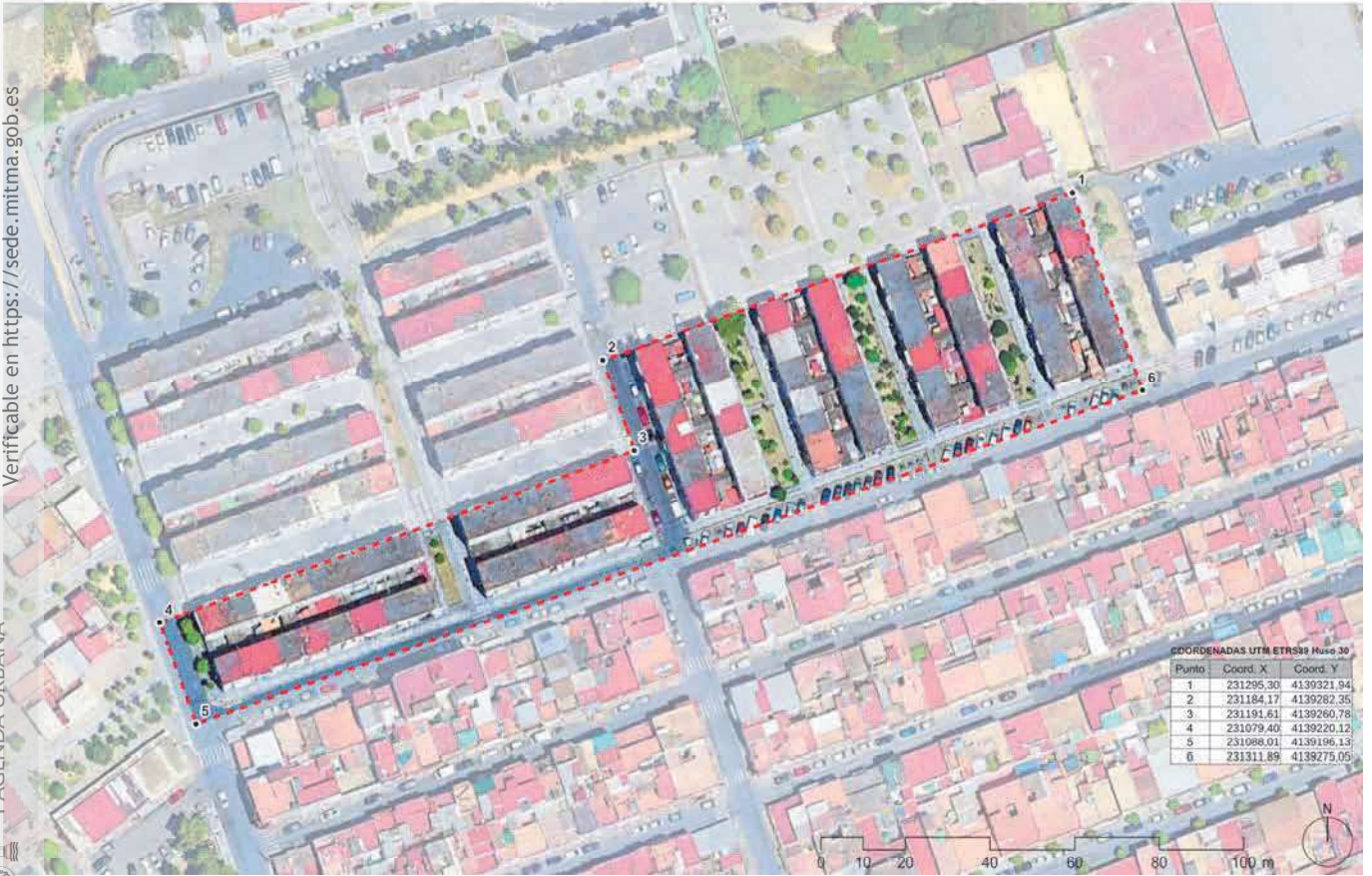
Delimitación del ámbito.