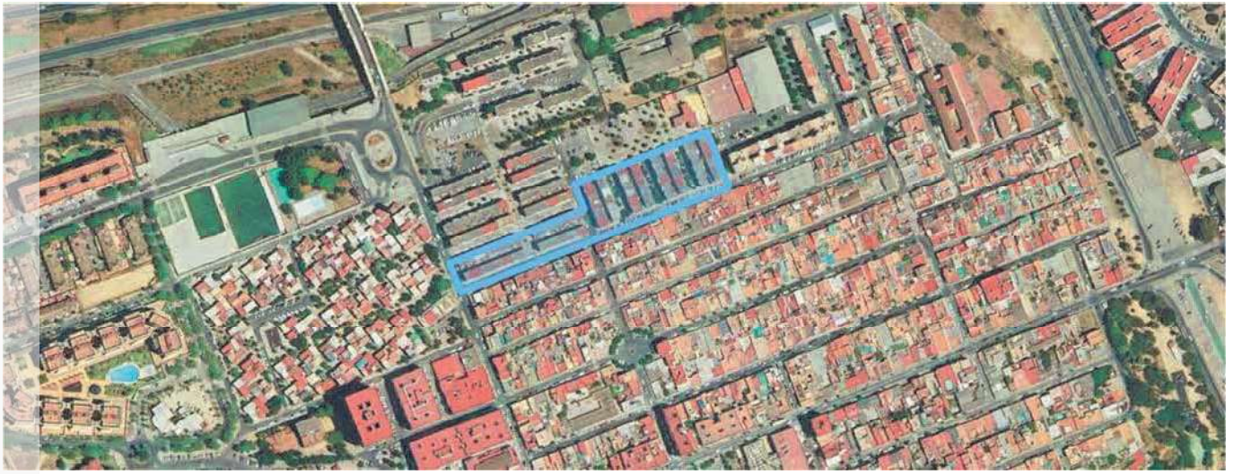
Localización del ERRP en el municipio de San Juan de Aznalfarache.