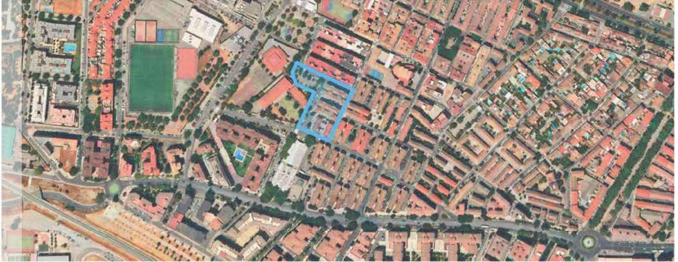
Localización del ERRP en el municipio de Granada.