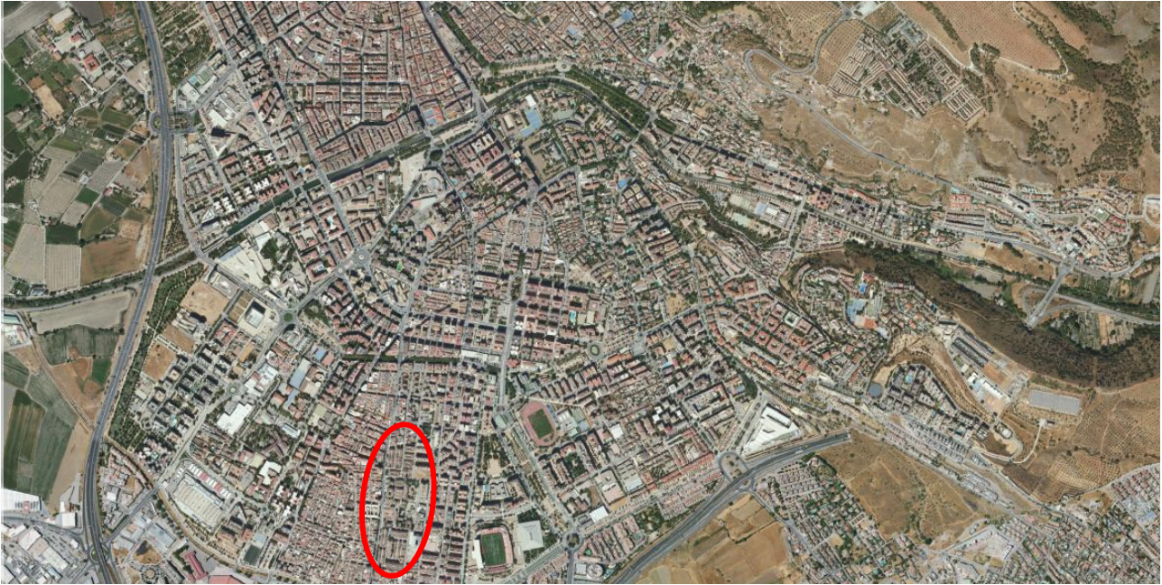
Localización del ERRP en el municipio de Granada.

SANTA ADELA - GRANADA DELIMITACIÓN DE ENTORNO RESIDENCIAL DE REHABILITACIÓN PROGRAMADA (ERRP)