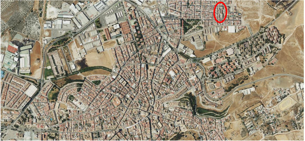
Localización del ERRP en el municipio de Morón de la Frontera.

EL PANTANO - MORÓN DE LA FRONTERA | SEVILLA DELIMITACIÓN DE ENTORNO RESIDENCIAL DE REHABILITACIÓN PROGRAMADA (ERRP)