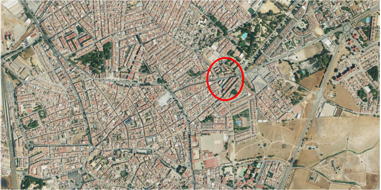
Localización del ERRP en el municipio de Utrera.

SAN CARLOS BORROMEIO - UTRERA | SEVILLA DELIMITACIÓN DE ENTORNO RESIDENCIAL DE REHABILITACIÓN PROGRAMADA (ERRP)