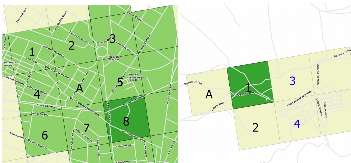
Ilustración 1. Esquema de vecindades para la estimación de la RMES de una celdilla A

La reducción del ámbito territorial de análisis, que pasa de ser una sección censal (con unas poblaciones más o menos equilibradas) a una celda regular de 250 metros o 1 kilómetro de lado, trae como consecuencia que las observaciones en la unidad de interés pueden no ser suficientes para la estimación del indicador RME y su significatividad. Debido a esto, se hace necesario buscar nuevos métodos que reduzcan la variabilidad del indicador para poblaciones pequeñas y que permitan calcular su significatividad de forma más eficiente. De esta búsqueda surge el método de suavizado bayesiano local, que no sólo utiliza la información de la propia celda, sino que también utiliza la estimación del entorno de la celdilla analizada como apoyo para obtener una población mayor y considerar su influencia en la mortalidad de la propia celdilla. A partir de este entorno y mediante técnicas de remuestreo es posible obtener un indicador suavizado y su intervalo de credibilidad a un nivel de confianza establecido que permita clasificar la celdilla en uno de los 5 grupos de mortalidad considerados: baja, moderadamente baja, similar a la media de Andalucía, moderadamente alta y alta.