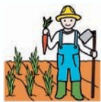
Consejería de Agricultura y Pesca.

Su jefe: El Presidente o Presidenta de la Junta de Andalucía. Nombra a Consejeros que mandan en las Consejerías