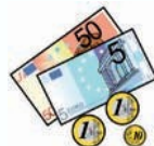
Consejería de Economía.