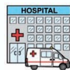
Consejería de Sanidad.