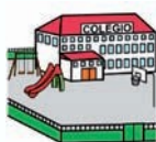
Consejería de Educación.