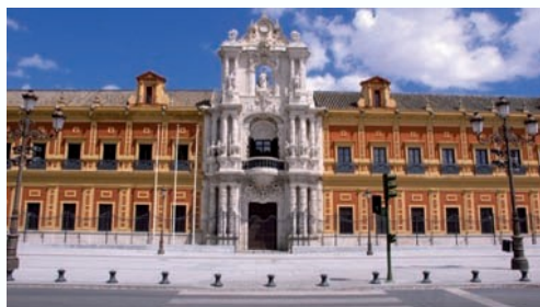
La Junta de Andalucía (Sevilla) gobierna en las 8 provincias andaluzas